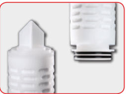
2-226フィンエンド (2-226 Fin)