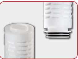
2-226フラットエンド (2-226 Flat)