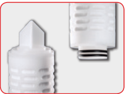
2-222フィンエンド (2-222 Fin)