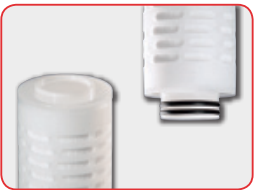
2-222フラットエンド (2-222 Flat)